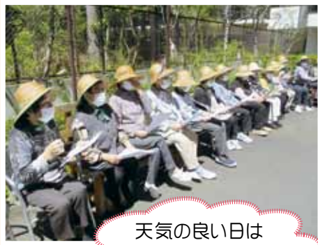
天気の良い日は 外で外気浴