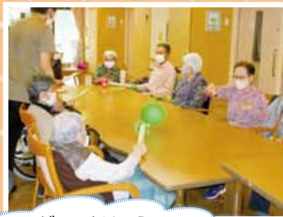
ゲームとはいえ 皆さんいつにも真剣です

毎日のリハビリ体操や レクリエーション 年間様々なイベント 行事を行っています!!