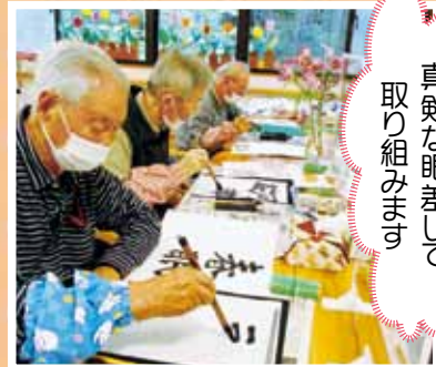
真剣な眼差しで 取り組みます