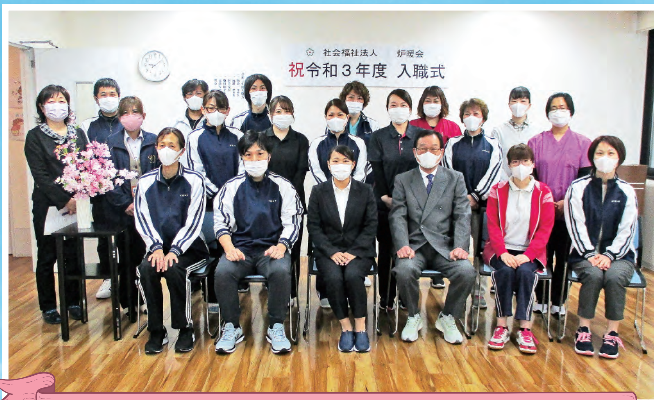
令和3年3月22日、炉暖の郷の会議室にて令和3年度入職式が行われました