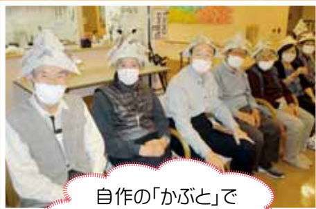
自作の「かぶと」で ゲームに挑戦