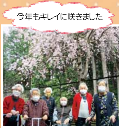
今年もキレイに咲きました