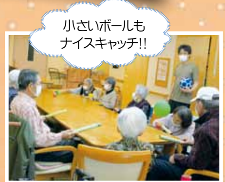
小さいボールも ナイスキャッチ!!