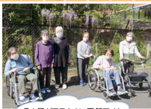
そよ風がこちよい季節ですね ショートステイの藤娘です