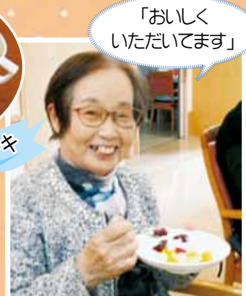
「おいしく いただいています」