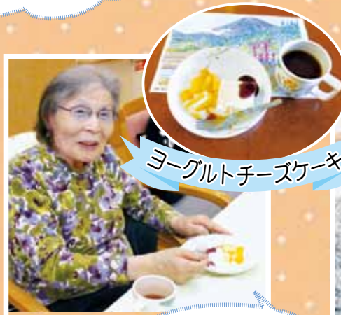
ヨーグルトチーズケーキ