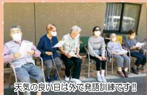
天気の良い日は外で発語訓練です！！