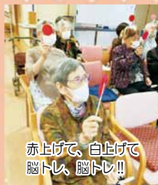
赤上げて、白上げて 脳トレ、脳トレ！！