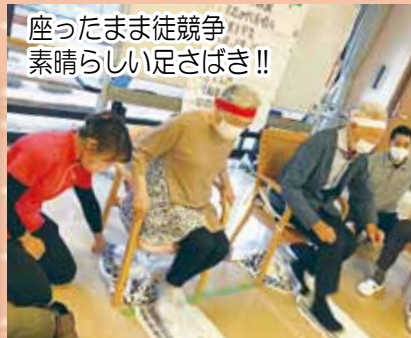
座ったまま徒競争 素晴らしい足さばき！！