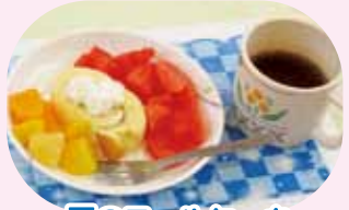
夏のロールケーキ