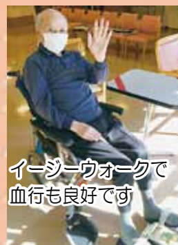
イージーウォークで 血行も良好です