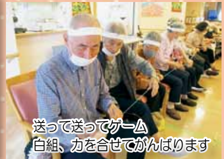
送って送ってゲーム 白組、力を合せてがんばります