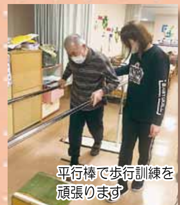
平行棒で歩行訓練を 頑張ります