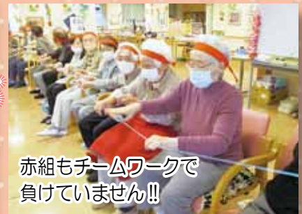
赤組もチームワークで 負けていません！！