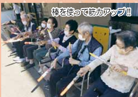
棒を使って筋力アップ！！