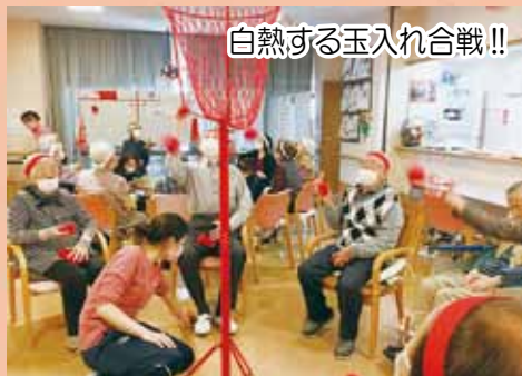
白熱する玉入れ合戦！！