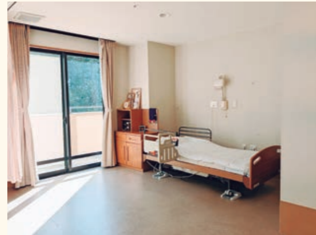
多床室においても個人のプライバシーが 守られるように配慮しております。